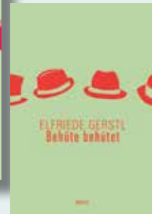
Behüte behütet Werke Band 2 432 Seiten