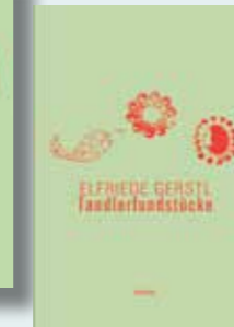
Tandlerfundstücke Werke Band 4 368 Seiten