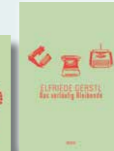
Das vorläufig Bleibende Werke Band 5 ca. 360 Seiten

Elfriede Gerstl Das vorläufig Bleibende Werke Band 5