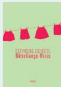
Mittellange Minis Werke Band 1 208 Seiten