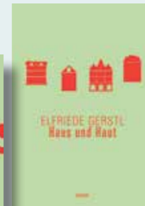
Haus und Haut Werke Band 3 398 Seiten